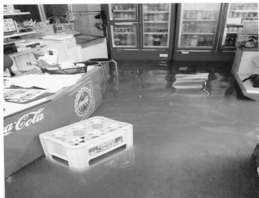
▲ 豪雨により浸水した店内