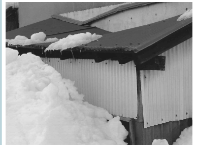
▲ 雪の重みでつぶれた屋根