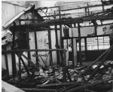
▲ 火災により焼けた建物